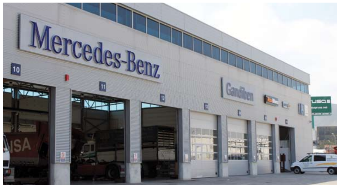
Instalaciones de TruckWorks Gandiben, en Palma de Gandía (Valencia).

conservación de los vehículos, pasando por codificación de piezas susceptibles de robo, montaje, desmontaje y parametrización de FleetBoards (servicio telemático), y mantenimiento de dispositivos como los detectores de carril y asistentes de distancia (sólo en camiones) u otros módulos especiales como el PSM. Además, su lista de servicios continúa con las revisiones preITV y otras inspecciones relacionadas con la prevención de accidentes, como la grúa de carga, todas ellas asociadas, como el resto de la oferta, al servicio de recogida y entrega de vehículo industrial.