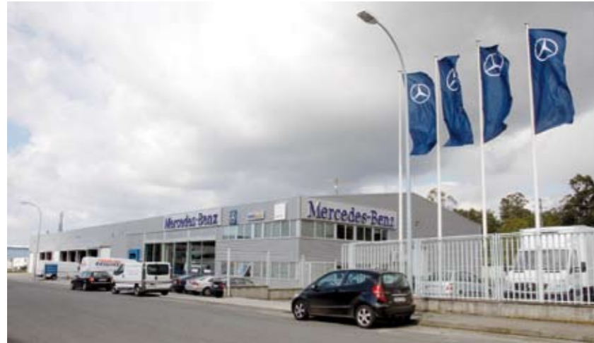
Louzao, integrante de TruckWorks en Betanzos (A Coruña).