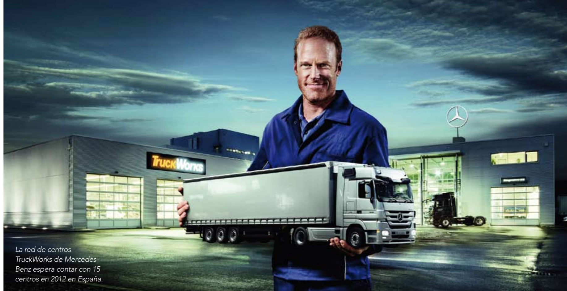
La red de centros TruckWorks de Mercedes-Benz espera contar con 15 centros en 2012 en España.

Así nace esta red, que ofrece un servicio integral en el que se repara absolutamente todo en vehículos de la firma Mercedes-Benz, pero también de otras marcas. De hecho, un proveedor externo se encarga de que nunca falten piezas de otros fabricantes en los almacenes de esta red.