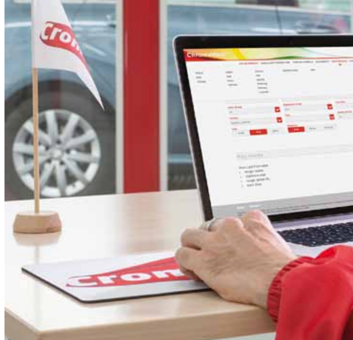
Chromaweb actualiza las fórmulas cuando está conectado a internet.

esté conectado a internet. Esta aplicación, en la que se puede entrar desde cualquier dispositivo, permite incluso acceder a las fórmulas creadas por otros talleres estén donde estén.