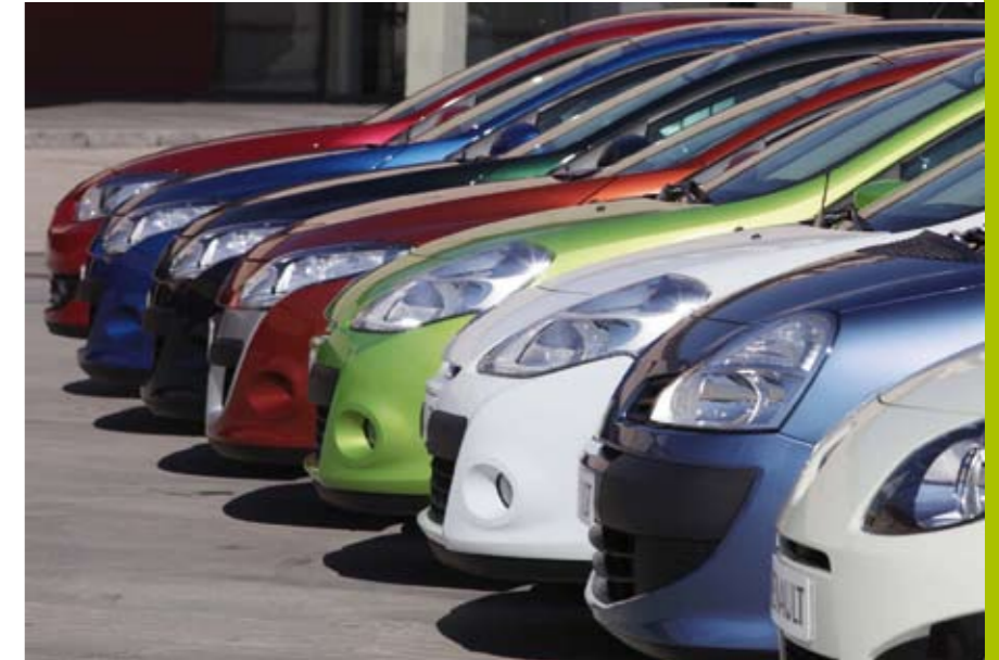
La gestión del mantenimiento de las flotas es fundamental para las empresas de renting.

MANTENIMIENTO. La gestión del mantenimiento de las flotas se ha convertido en un aspecto fundamental