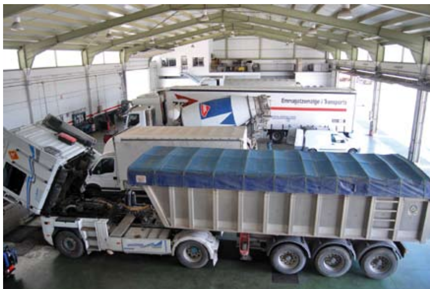
Zona de taller de Comequin.

días laborables en la sede de Cojali, en Campo de Criptana (Ciudad Real), con un máximo de 15 alumnos por clase. La formación incluye contenidos teóricos y prácticas con bancos de ensayo y camiones reales, impartidos con temario propio por personal de Cojali.