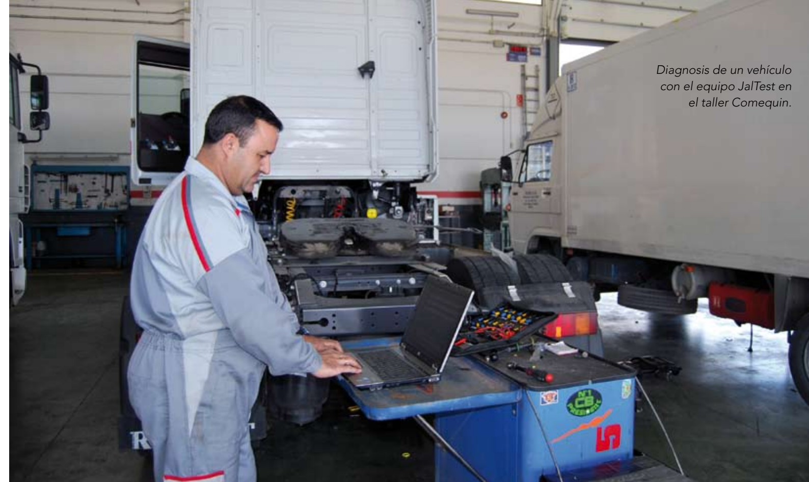
Diagnosis de un vehículo con el equipo JalTest en el taller Comequin.

Consciente de esta necesidad, Cojali, fabricante de la solución de diagnosis multimarca para vehículo industrial, comercial ligero y agrícola JalTest, puso en