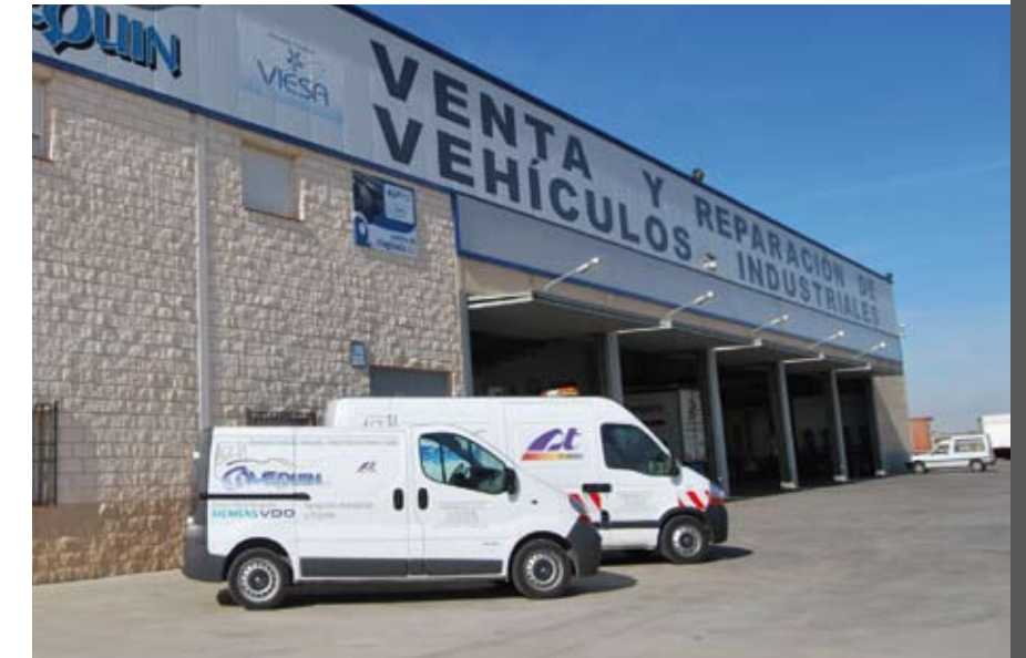
Comequin, Servicio Autorizado JalTest en Quintanar de la Orden (Toledo).