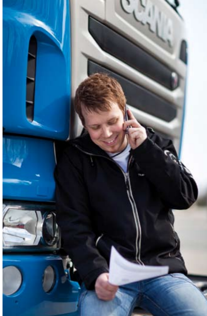
Los centros de atención al transportista suelen atender en todos los idiomas de la UE y durante 24 horas.

Según sus cálculos, en 2010 su tiempo medio de atención a transportistas con necesidades mecánicas relacionadas con los neumáticos se situó en una hora y 37 minutos.