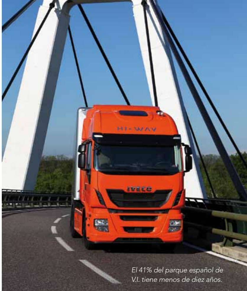
El 41% del parque español de V.I. tiene menos de diez años.