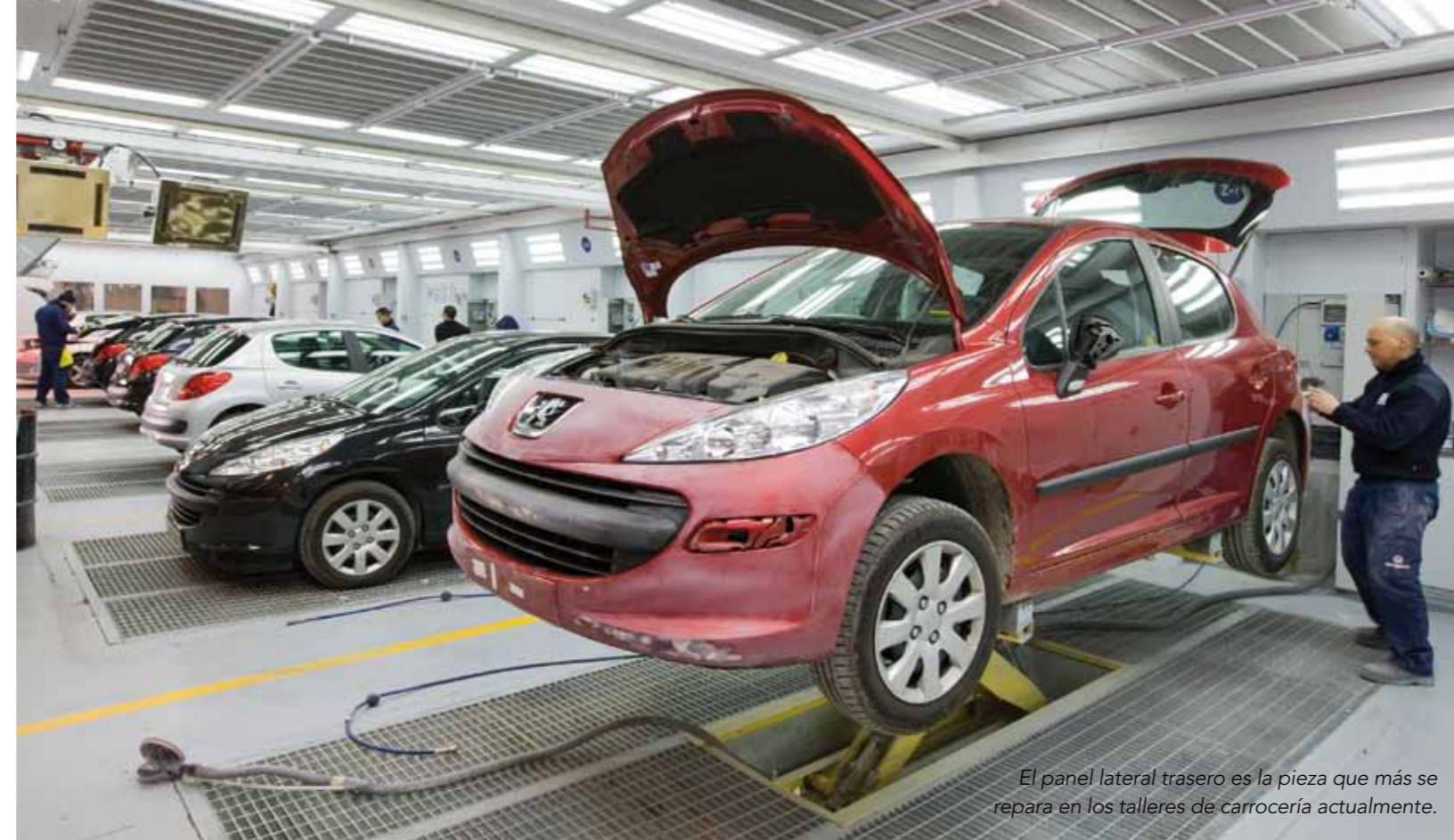
El panel lateral trasero es la pieza que más se repara en los talleres de carrocería actualmente.

Precisamente los dispositivos de seguridad del vehículo evitan en muchas ocasiones este tipo de colisiones que, consecuentemente, dejan de verse tan a menudo