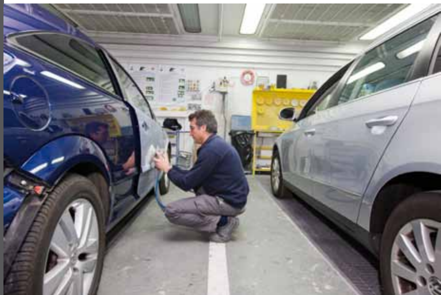
Las puertas delanteras se ven afectadas en los golpes laterales, que suponen uno de cada cinco.

talleres y cuyo precio medio es de 93 y 72 euros, respectivamente.