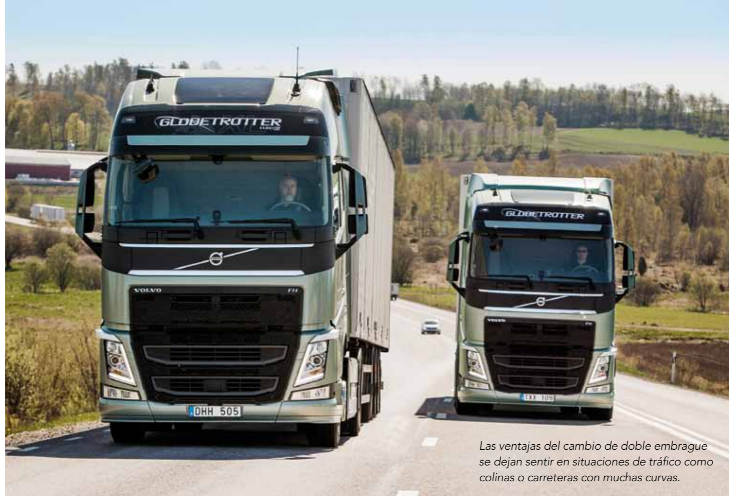
Las ventajas del cambio de doble embrague se dejan sentir en situaciones de tráfico como colinas o carreteras con muchas curvas.

Con el sistema de doble embrague, y gracias a una caja de cambios electrónica, se podrá cambiar de marcha sin interrumpir la transmisión de potencia. De