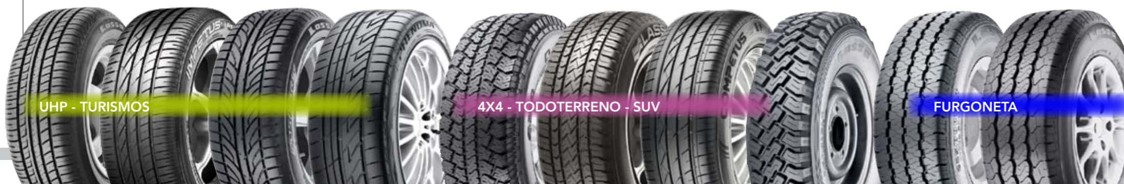
UHP - TURISMOS

Forma parte de la amplia gama de neumáticos de invierno de Lassa. Tracción, adherencia y excelente precisión en la dirección son las características más destacadas del nuevo modelo. Ofrece un alto rendimiento sobre nieve, hielo y hielo fundido. Disponible en un amplio rango de medidas.