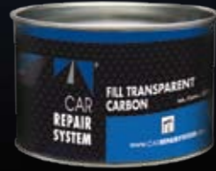
FILL TRANSPARENTE CARBON