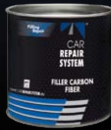
FILLER CARBON FIBER