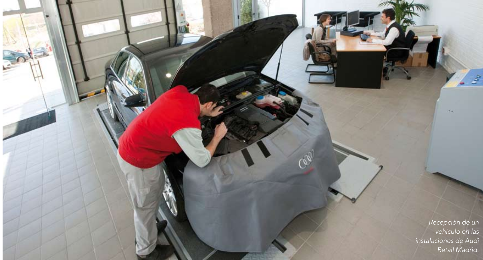
Recepción de un vehículo en las instalaciones de Audi Retail Madrid.

Un gran taller que suma 18.000 metros cuadrados de instalaciones y da trabajo a un centenar de profesionales. Todo ello, especializado en la marca Audi. En pleno auge de los procesos de concentración en los concesionarios, dos grandes han sumado sus actividades y han creado un nuevo concepto: Audi Retail Madrid.