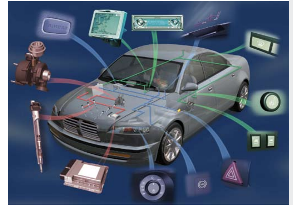
Los automóviles actuales cuentan con sistemas electrónicos cada vez más complejos.

En los talleres, se ha pasado de tener miedo al equipo de diagnóstico a temer que se nos estropee, porque ya no sabemos hacer nada sin pasar por él