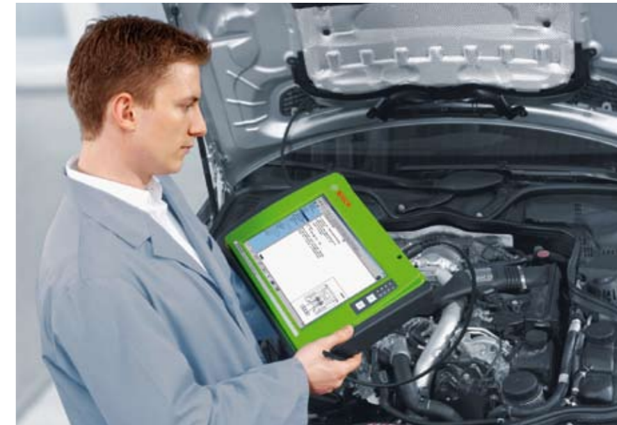
La diagnosis ha transformado el sector de la reparación de vehículos.

Por cierto, encontré una nueva aplicación para mi libreta: en ella apunté el significado de tantas y tantas abreviaturas que aparecen cada día en el trabajo diario, como CAN, BUS, LIN, ABS, ESP, ASR, CR, EBS, Start/Stop, Smart Starter, Denoxtronic, Di-Motronic, VP44, UIS, etc.