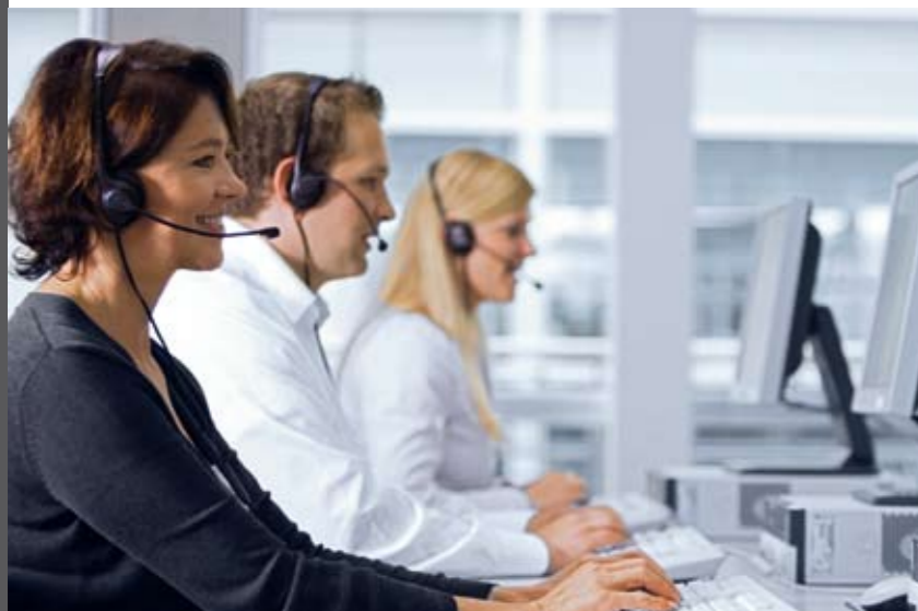
A través del sistema ConnectDrive, el conductor puede concertar una cita con su taller.

adicional, o quiere continuar al siguiente paso, puede pedirselo al sistema de viva voz, gracias a un micrófono que reconoce su propio tono y transmite su orden.