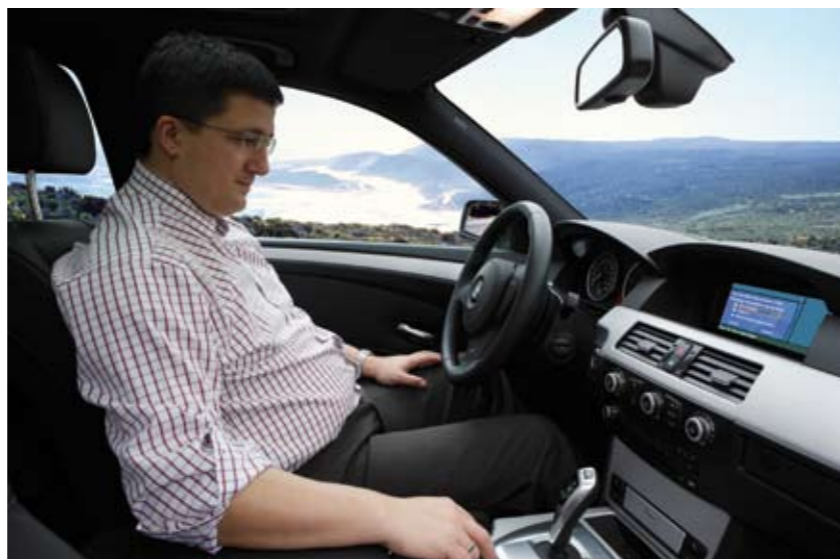
El vehículo envía toda la información necesaria sobre su estado al Servicio BMW.

COCHE Y TALLER, CONECTADOS. Además de utilizar sus gafas para reparar un vehículo, el profesional del taller puede incluso concertar una cita con su cliente sin siquiera saber dónde se encuentra gracias a una de las aplicaciones de ConnectDrive, otro de los proyectos de investigación de BMW que conecta el vehículo a Internet, con todas las ventajas que esta conexión representa.