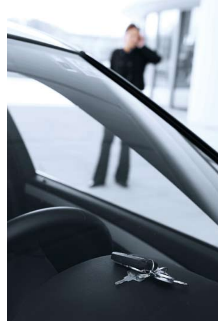
El conductor despistado puede desbloquear el cierre de su vehículo con sólo una llamada.

Los especialistas del servicio de Asistencia de BMW pueden así hacerse una idea precisa de las condiciones del coche, y en muchos casos pueden