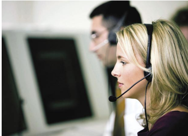
Los call centers se encargan de coordinar los trabajos de reparación.

En segundo lugar, estas empresas ofrecen grandes ventajas a sus clientes directos. La externalización del servicio de gestión de siniestros es un gran aliciente en un entorno empresarial en el que cada vez es mayor la tendencia a convertir los costes variables en fijos a través de la contratación de especialistas en distintos ámbitos.