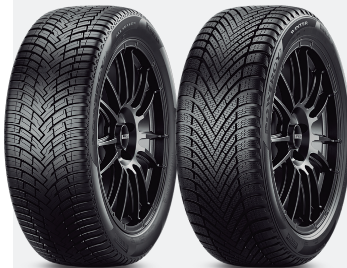
Powergy All Season SF (todo tiempo)