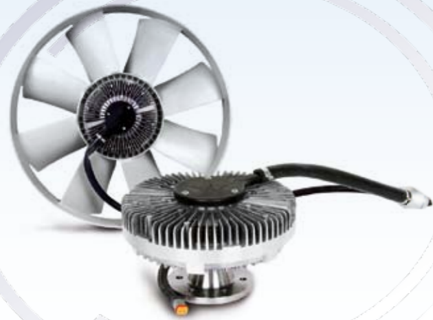
SISTEMAS DE REFRIGERACIÓN