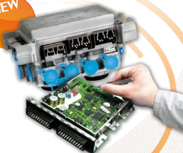
INVESTIGACIÓN Y REACONDICIONADO