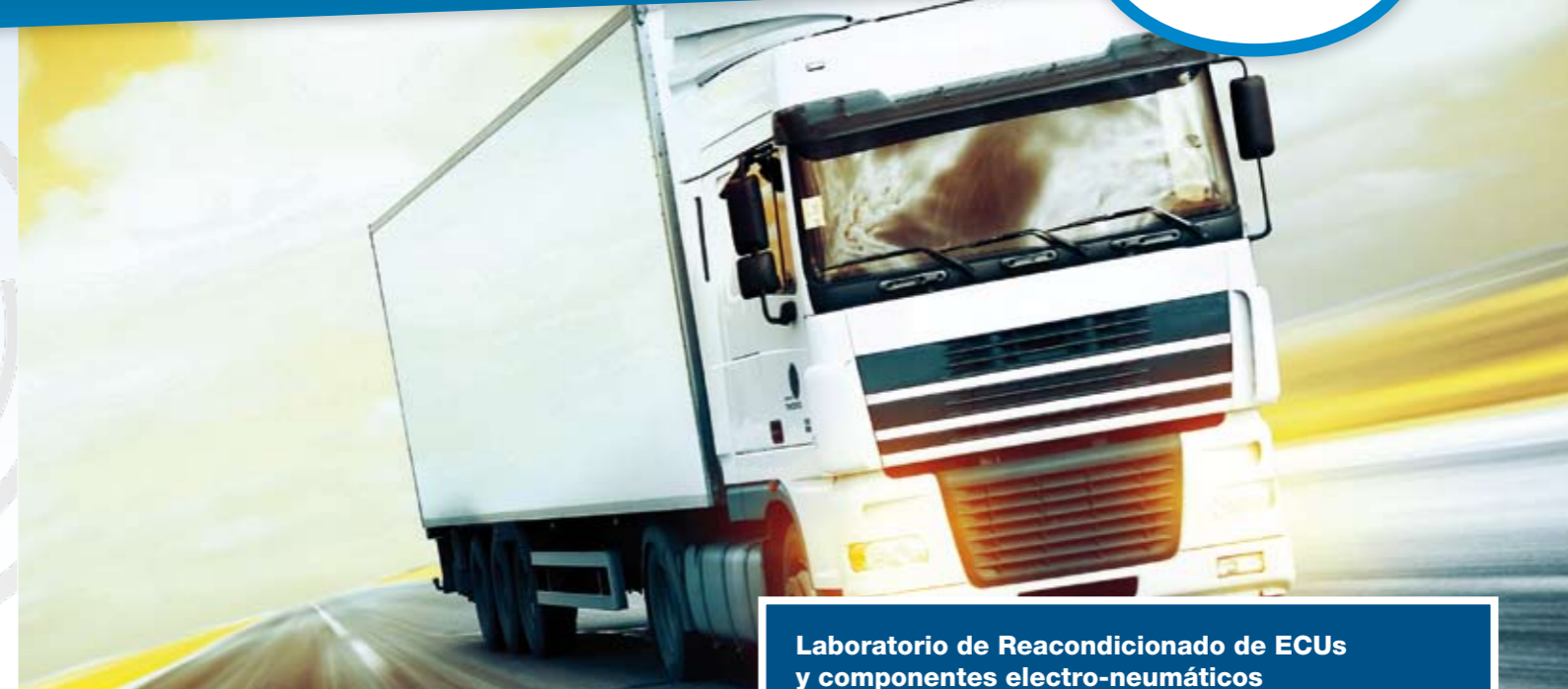
Laboratorio de Reacondicionado de ECUs y componentes electro-neumáticos

Tras varios años de investigación ve la luz la última novedad del departamento de I+D+i de Cojali: la creación de un laboratorio de reacondicionamiento de unidades de control electrónico y componentes electroneumáticos que pretende ofrecer una opción de calidad con las mismas prestaciones de un producto nuevo pero con el valor que le da la garantía Cojali.