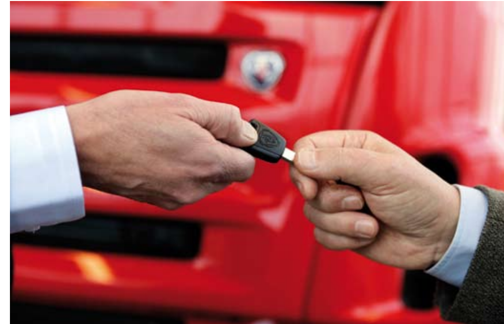
La posventa compensa las malas cifras del resto de líneas de negocio, en especial la de ventas de unidades nuevas.

Las ideas de que, con la crisis, los conductores llevarían su camión, autobús o cualquier otro vehículo industrial a reparar más, porque no tendrían dinero para cambiarlo por uno nuevo y que, con la edad, este tipo de vehículos necesitaría más mantenimientos, han demostrado ser verdades a medias. Lo cierto es