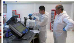
Pintores Premium Partners realizando uno de los cursos técnicos.