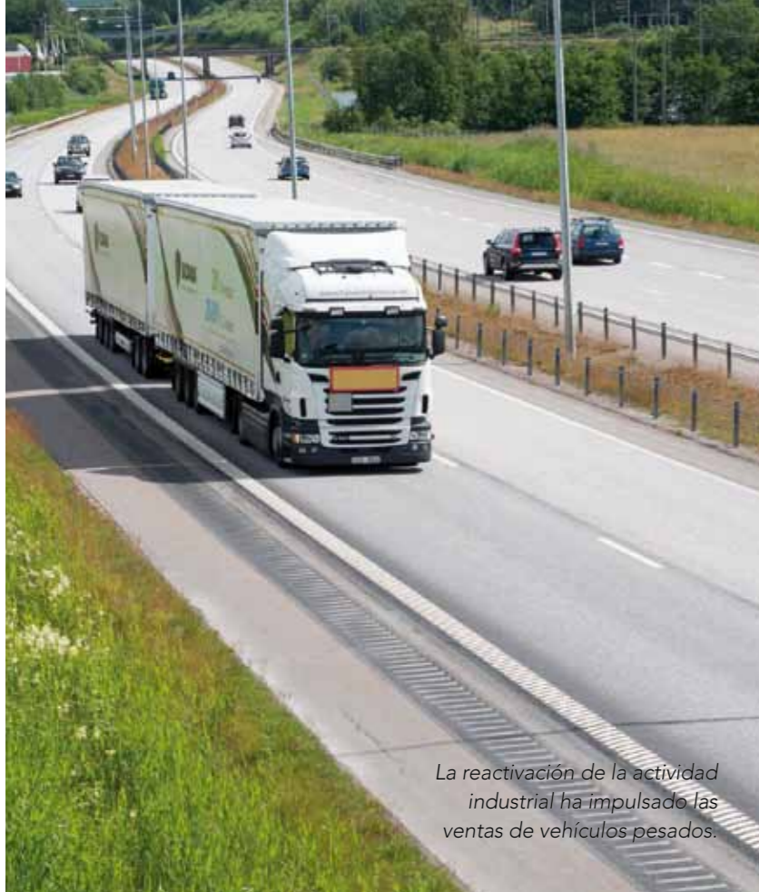
La reactivación de la actividad industrial ha impulsado las ventas de vehículos pesados.