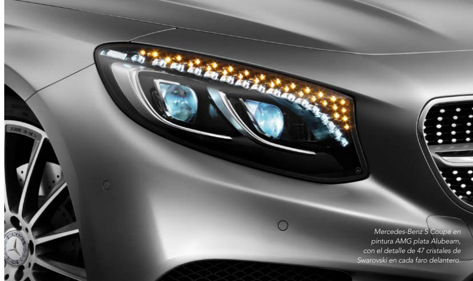
Mercedes-Benz S Coupé en pintura AMG plata Alubeam, con el detalle de 47 cristales de Swarovski en cada faro delantero.

Vehículos únicos y personalizados. Los conductores buscan la diferenciación y las marcas les ofrecen conceptos y paquetes exclusivos de carrocería, con los que pueden elegir colores especiales o crearlos directamente, o incluir elementos distintivos como manillas o carcasas de retrovisores en nuevos materiales. Carrocerías a la carta con todo lujo de detalles.