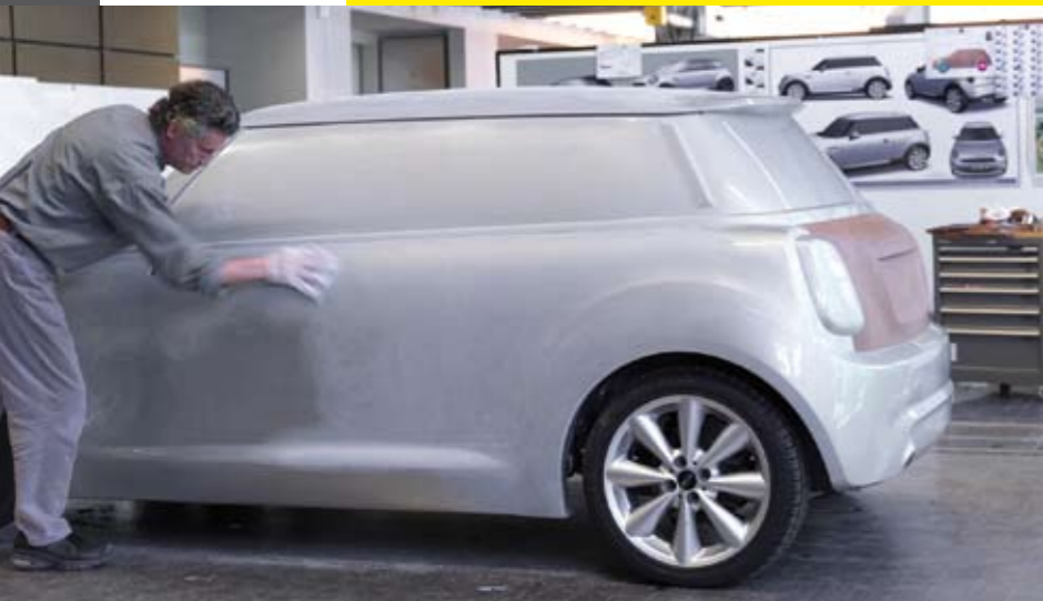
Proceso de diseño del Mini.

Por otro lado, es habitual en la marca de origen británico lanzar ediciones especiales , en las que los colores son grandes protagonistas. En 2013, Mini lanzó la edición Play de Fluor , con colores flúor que no pasan desapercibidos, que pueden combinarse con tonos como el amarillo limón o el verde alien .