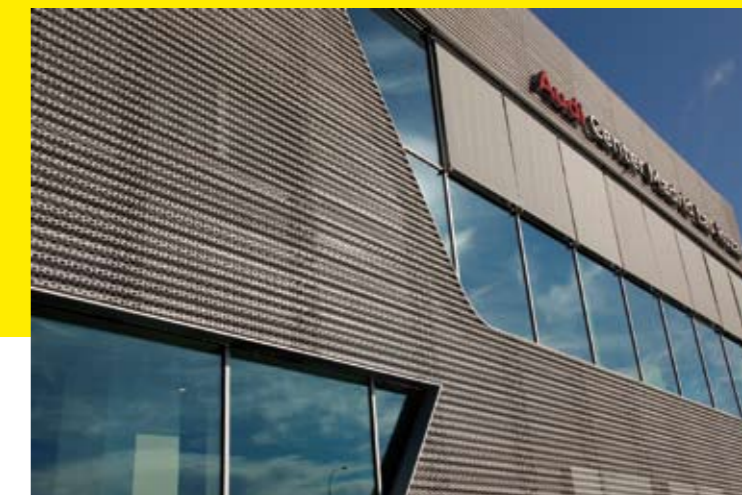
Las instalaciones de Audi Center Madrid Las Rozas ocupan más de 9.000 m 2 .

generación, basada en los procesos marcados por Audi. Este centro es un claro exponente del nuevo concepto de la enseña en sus instalaciones, 'Audi terminal', que se integra en el entorno urbano y busca un nuevo modo de relación de la marca con el cliente.