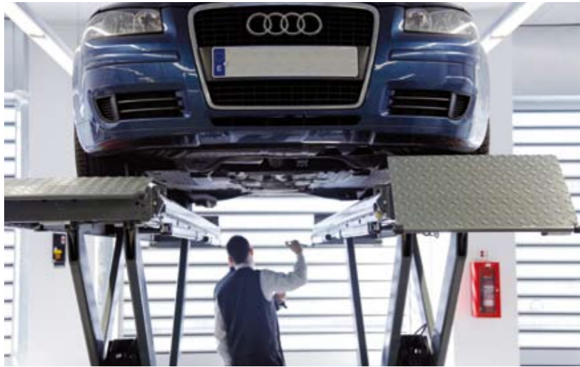
El servicio de Recepción Directa ofrece información en tiempo real al cliente sobre los trabajos necesarios en el vehículo.

lavado, a los que se suma una imponente terraza para la zona de vehículos de ocasión. El centro del recinto se ha dedicado a la exposición de vehículos nuevos, complementado con una terraza exterior que permite exponer hasta 50 vehículos.