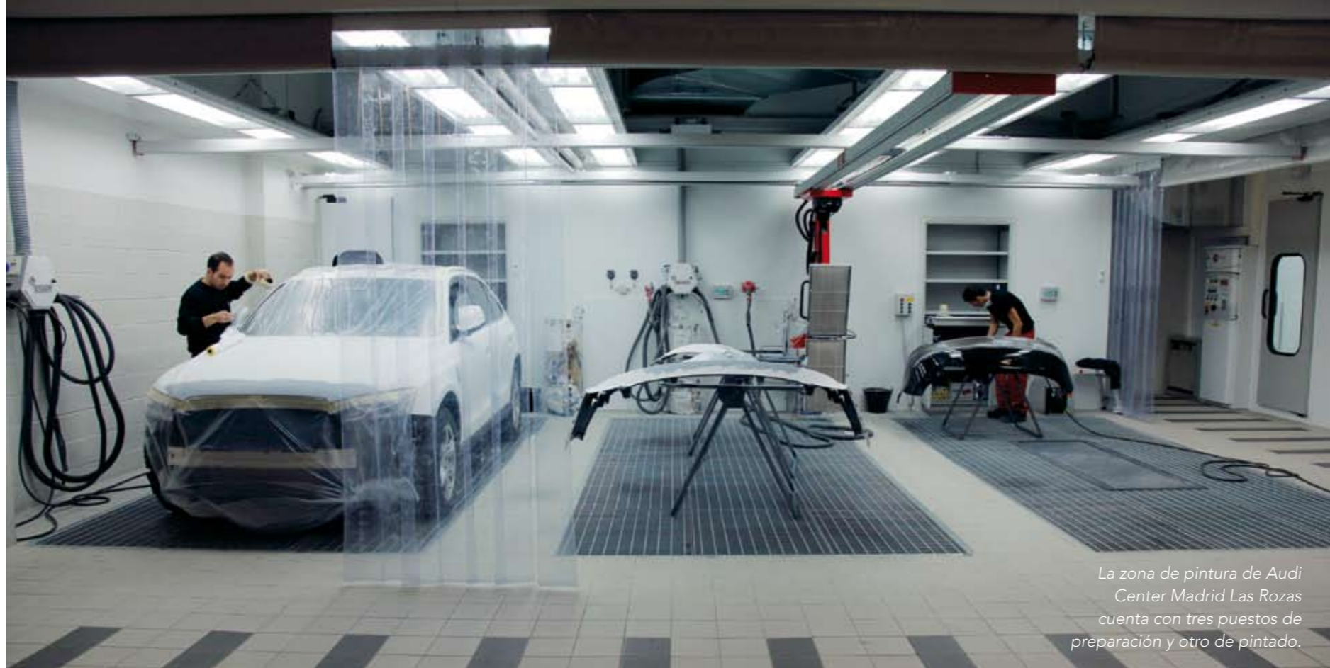
La zona de pintura de Audi Center Madrid Las Rozas cuenta con tres puestos de preparación y otro de pintado.

CENTRO AUDI DE REFERENCIA. En medio de este panorama, dos grandes concesionarios de Madrid, Castellana Wagen y Vallehermoso Wagen, no dudaron en unir sus fuerzas para crear Audi Retail Madrid, la mayor concesión de la enseña en toda Europa. Fruto