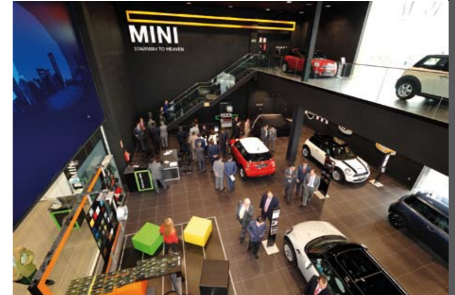
Espacios vanguardistas en la zona de exposición de vehículos.

La innovación de este concesionario no se queda sólo en sus instalaciones, sino que también estuvo presente en su campaña publicitaria de lanzamiento. Querían que fuera eficaz y diferenciadora al mismo tiempo, por lo que buscaron un mensaje claro, emotivo y directo, que no pareciera, a primera vista, el de un concesionario. “El eslogan ‘Advertencia: Te robaremos el corazón unos momentos’ es un mensaje que te obliga a profundizar, a descubrir por qué”, comenta el gerente de Momentum.