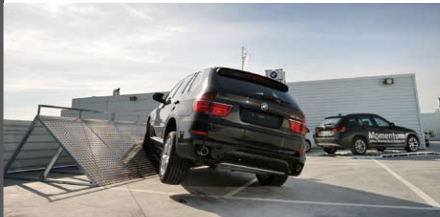
Área de pruebas en la cubierta de las instalaciones.

El concesionario cuenta también con un pequeño hoyo, para que, mientras esperan la puesta a punto de su BMW o Mini, los amantes del golf puedan probar sus golpes indoor. Por otro lado, dispone de su propio espacio cultural, en el que se podrán ver exposiciones a lo largo del año. Pintura, fotografía y escultura se darán cita en este recinto.