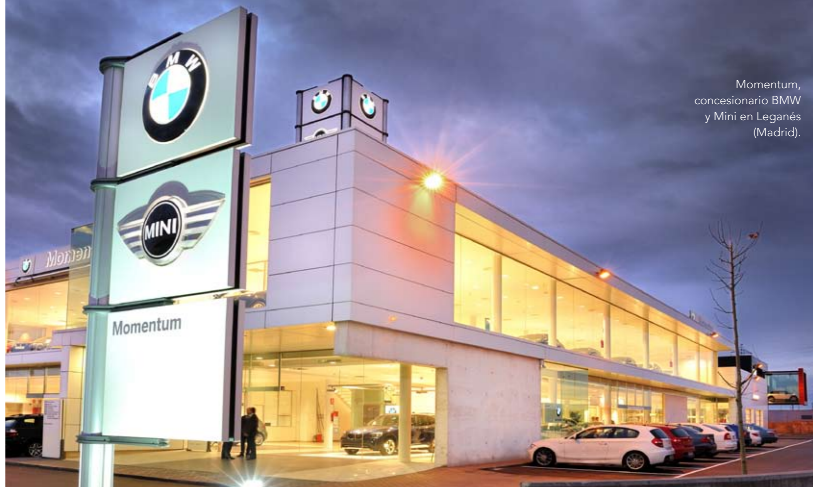
Momentum, concesionario BMW y Mini en Leganés (Madrid).

MÚLTIPLES SERVICIOS. El restaurante del centro es un lugar tranquilo, de ambiente acogedor. Diseñado con un corte vanguardista -en sintonía con la estrategia del propio concesionario-, busca crear en el cliente un estado de ánimo positivo. Dispone de conexión WiFi a Internet, sirve comidas diarias y permite pedir a cualquier hora platos para llevar. Está pensado para que los clientes puedan comer, leer el periódico o consultar su correo electrónico mientras esperan recibir su coche.