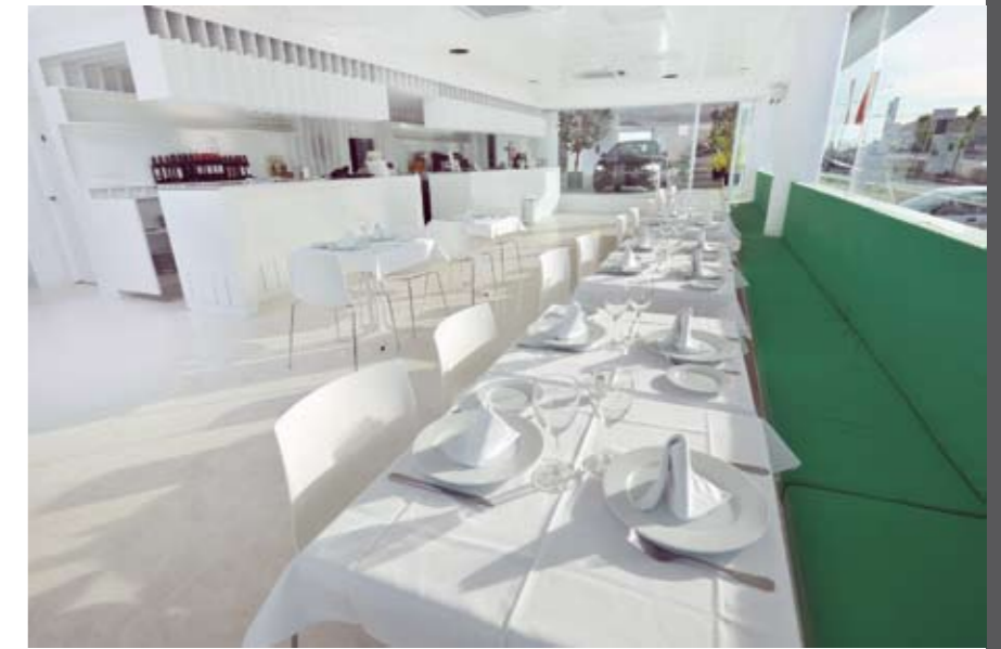
El restaurante Momentum: un lugar para relajarse y disfrutar.

Momentum ofrece servicios exclusivos para posventa, como la recogida y entrega a domicilio del vehículo, el alquiler de automóviles y el servicio de desayuno gratuito para los clientes